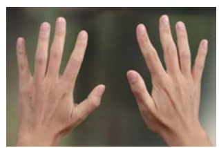
爪を短くすること