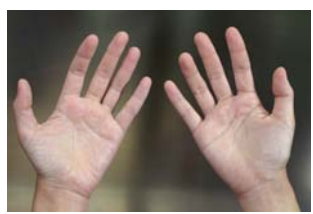
目視で汚れを確認