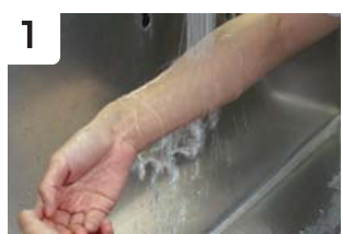
1 手、前腕、肘関節上部まで濡らす 水道水でも良い