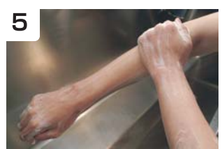
5 手関節 前腕、肘関節上部まで