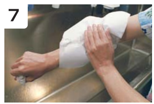
7 非滅菌ペーパータオルで水分を拭き取る