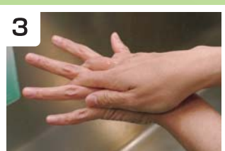
3 両手 手背、指間