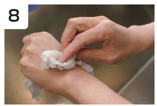
8 十分に水分を取り除く (以後の消毒効果に影響する)