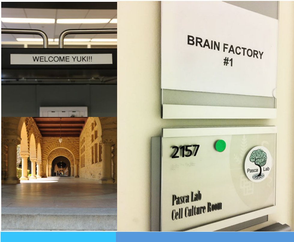
写真左上: ラボ初日。デスクに Welcome のシールが。写真左下: スタンフォード大学キャンパス内の建築物。写真右: Pasca Lab 細胞培養室。別名 BRAIN FACTORY。