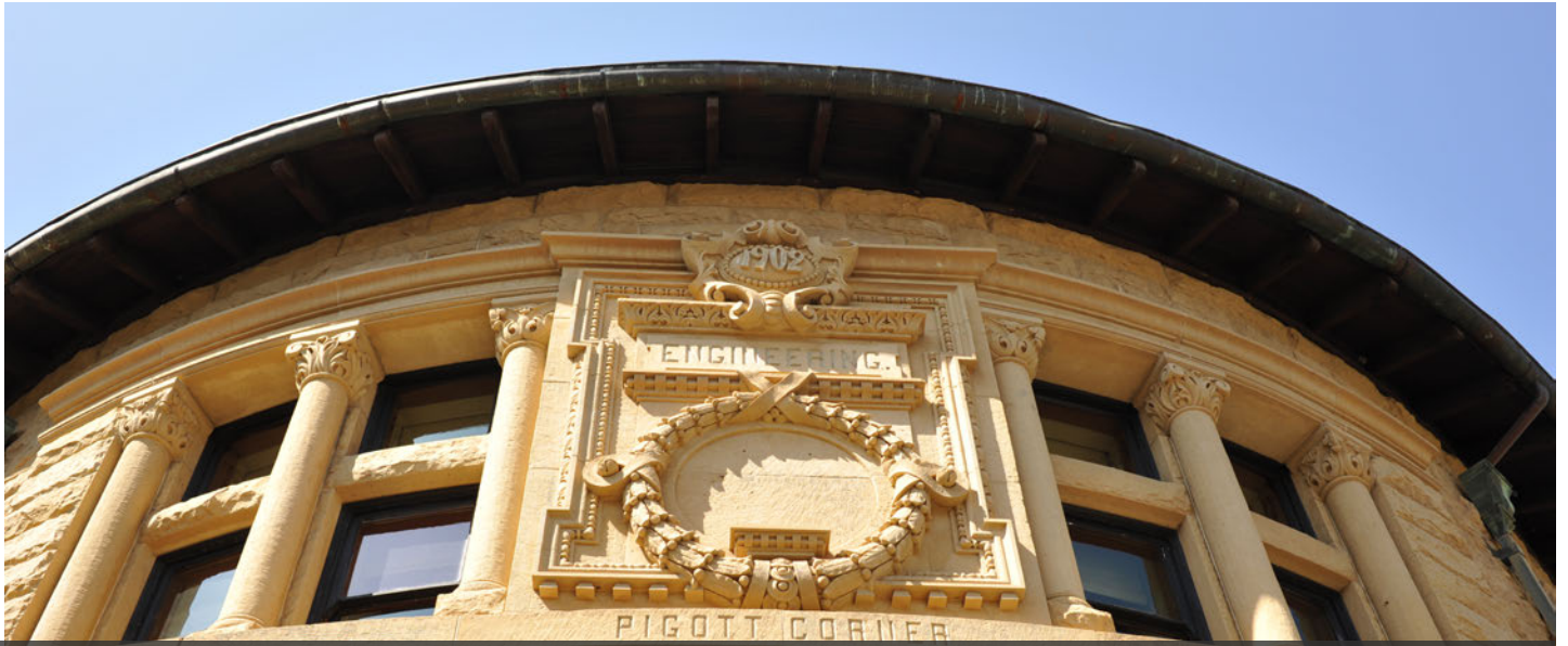
スタンフォード大学キャンパス内を散策中の 1 枚