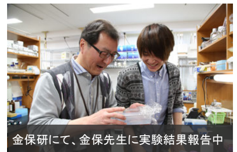
金保研にて、金保先生に実験結果報告中

著に見えてきて、「自分を知る」という体験にも繋がり、人間としても一回り成長できたように感じます。この留学の経験があったからこそ、海外に視野を広げて卒業後の進路を選ぶことができました