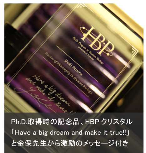
Ph.D.取得時の記念品、HBP クリスタル「Have a big dream and make it true!!」と金保先生から激励のメッセージ付き